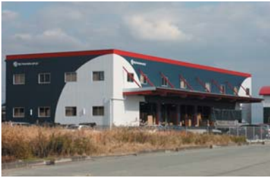
タンスのゲン 本社

Yahoo!ショッピング生活部門、今年上半期第一位のコマースサイトをご紹介しよう。それは「タンスにゴン」ではなく、「タンスのゲン」。