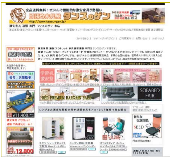
「タンスのゲン」自社サイト トップページ

らにスタッフ一丸になっ て行う即日対応。「売れ筋の約 三〇〇商品を午後二時までの 注文であれば、即日発送でき ます。それ以外でも質問やク レームにも徹底して即日対応 に心がけています。買い取り を行うバイヤー、出荷担当、 受注担当のスタッフも『迅速