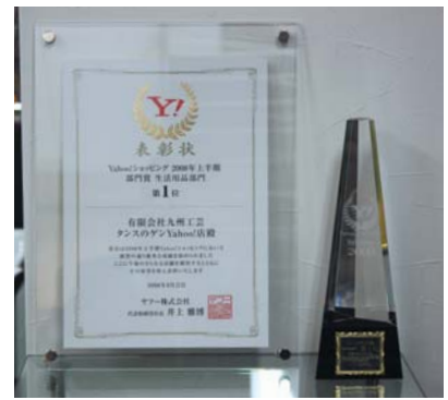
Yahoo! ショッピング生活部門 今年上半期第一位