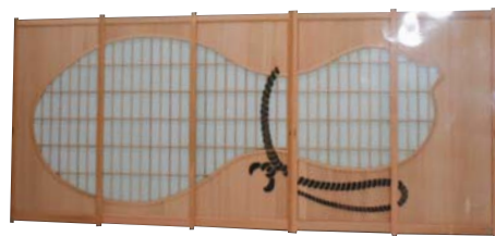
赤福本店から注文があった障子

くりを目指している。「最近で は、新築物件で和室が少なく なりました。あっても一部屋 ぐらいです。技術力や付加価 値ある製品が求められると思 っています。」一方で、自分 おもしろいと感じる製品を作 りたいとも思っておられる。「最 近では、赤福本店から注文が あった、ひょうたんのデザイ ンの障子がおもしろかったで すね。」今後にも期待したい。