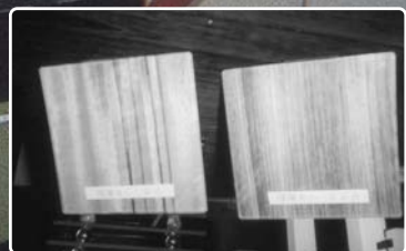
木目を出した突板貼りガラス