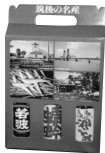
「飲みくらベセット」

ど関心はありません。お酒は嗜好品ですから若波のお酒にこだわりを持って下さるお客様と未永くおつきあいできるようにしたいですね。もっとも伝統の味を基本に、その延長線上で新しい商品開発は進めていきたいと思っています。」 「どんなお酒だろうか。ここやかに答えて下さった。」 「疲れたときに癒されるとっておきのお酒とでも言いましょうか。(笑)」