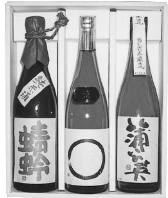
おすすめのお酒 蜻蛉(とんぼ)

さて、おすすめのお酒を聞いてみた。すると蜻蛉(とんぼ)という答えが返ってきた。もちろんお酒の名前である。「蜻蛉は、純米酒よりさらに米を磨いた『特別純米酒』で、麴米に山田錦、掛米にはレイホウを、そして仕込み水には、日本名水百選・阿蘇の白川水源水を使っています。添加物も一切使用していません。」