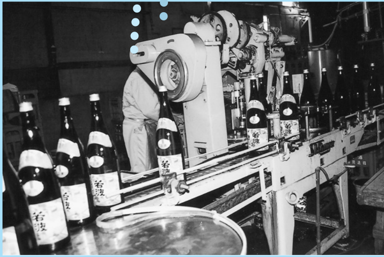
若波のできあがり