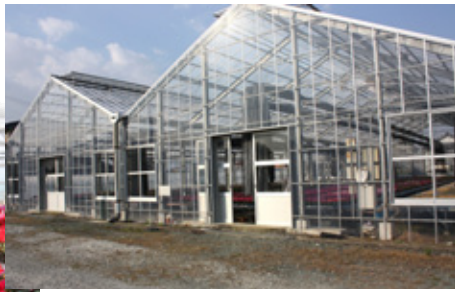
ガラス温室の外と中の様子