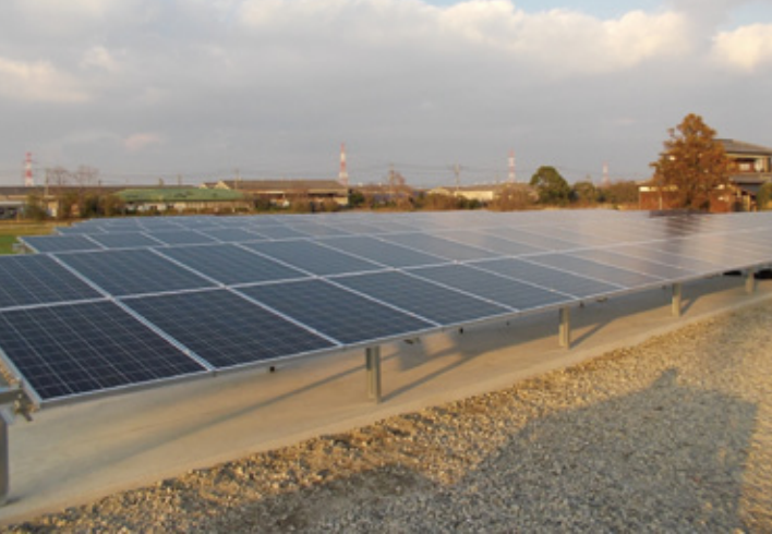
産業用太陽光発電システム

てメリットが出るとは考えません。それぞれのご家庭の状況にあう、一番最良の方法を提案したいと思います。」 そしてたとえば、一人、年金で暮らしているおばあさんの家には、電気設備と言うより、コストが小さいガスの設備を提案する。 修理の依頼は、メーカー任せにすることは決してない。必ず訪問する。しかもできるだけ迅速に。なぜだろうか。 「水漏れやトイレのつまりなどの故障は、お客様にとって不安なものです。速く駆けつけて安心してもらうことは大切と考えています。」緊急の場合は、二十四時間対応す