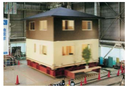
震度7クラスの激震にも損傷なくその強さを実証した高耐震性能。

「私は自信を持って新世代エコハウスを勧めています。お客様にもメリットが大きいですし、地球環境にも、とても良いからです。」 マイクハウスの特色は、省エネだけではない。日本最大のホームビルダー集団、ジャーパーネット (JAHNet) に所属しているのだ。六〇〇社の企業が参加している。年間一万棟を建てている。大手の積水、ダイワに対抗する力を持っている。福岡県では約十社、もちろん大川ではマイクハウスのみである。 低コストを実現した。「すべての材料は共同仕入れで、安価に材料を仕入れることができます。また、ジャーパーネットのノウハウを使って建築します。これで、「適正価格」を実現しています。」 しかも、ジャーパーネットが要求する、品質基準は、建築基準法を大幅に上回るレベルである。図にあるとおり、耐震耐風、空気環境、温熱環境などの分野である。震度七クラスの激震にも耐える。二〇〇四年の新潟中越地震では、ジャーパーネットの家は全半壊ゼロであった。信頼性の高さを示している。