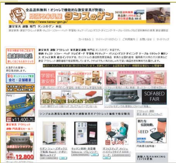
「タンスのゲン」自社サイト トップページ

「タンスのゲン」の強みの一つは三〇〇〇商品の豊富な品揃え。五カ所の自社倉庫に在庫を持つている。さらにスタッフ一丸になって行う即日対応。「売れ筋の約三〇〇商品を午後二時までの注文であれば、即日発送できます。それ以外でも質問やクレームにも徹底して即日対応を行うバイヤー、出荷担当、受注担当のスタッフも『迅速