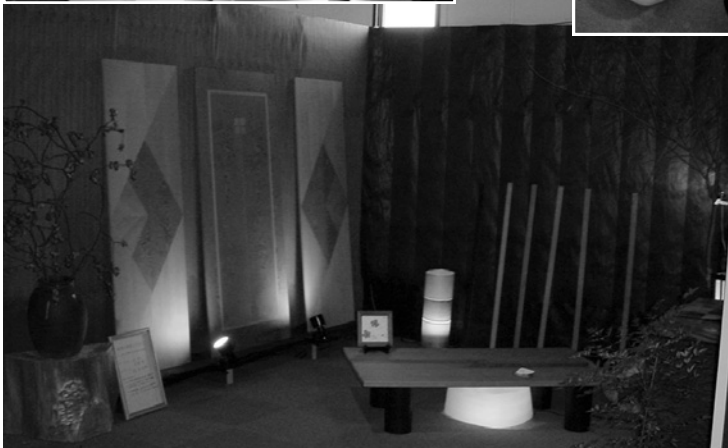
和風の中で独特の色彩をもっている