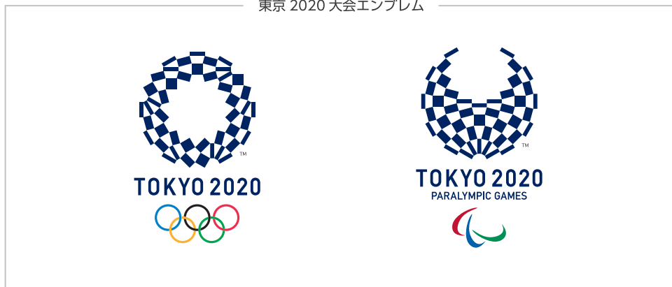
東京 2020 大会エンブレム

東京 2020 ライセンシングプログラムとは、公益財団法人東京オリンピック・パラリンピック競技大会組織委員会（以下、組織委員会という）が保有する東京 2020 大会に関するマーク、公益財団法人日本オリンピック委員会（以下、JOC という）が保有する JOC 及びオリンピック日本代表選手団に関するマーク、並びに、公益財団法人日本障がい者スポーツ協会日本パラリンピック委員会（以下、JPC という）が保有する JPC 及びパラリンピック日本代表選手団に関するマークを契約した商品に使用して製造及び販売するプログラムです。ライセンシングプログラムより得られる収益は、東京 2020 大会の準備・運営費、並びに、オリンピック及びパラリンピック日本代表選手の育成・強化事業等に活用されます。